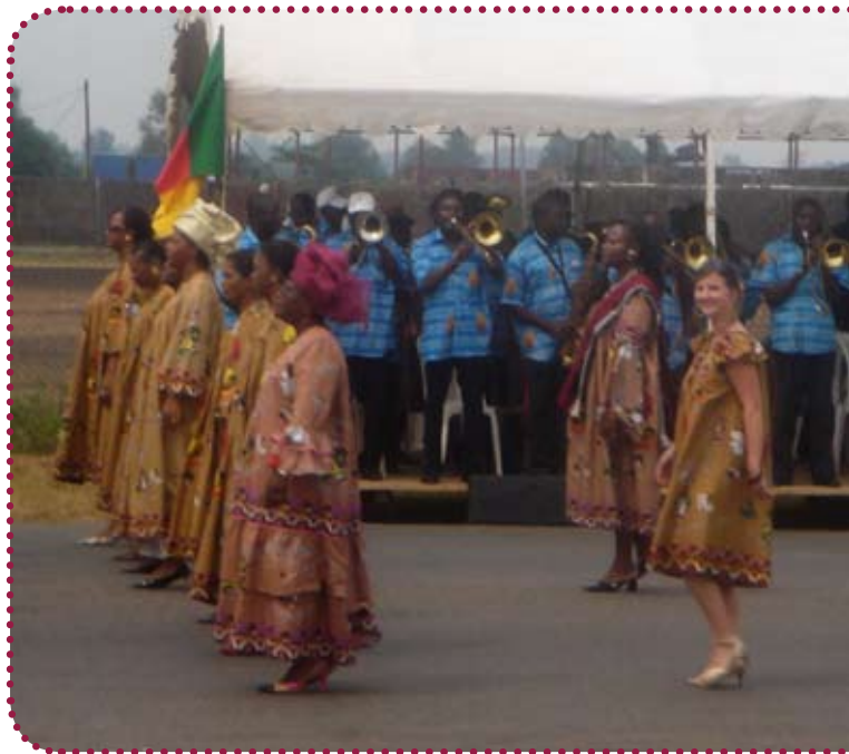
8. marts - kvindernes kampdag er en stor dag i Cameroun. Jeg var så heldig at få lov at deltage i det store optog, iført den reglementerede kjole, som skifter mønster hvert år.