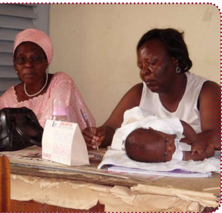
Mens jeg var der modtog socialministeriets regionale kontor to babyer, som var blevet fundet på gaden. Ofte bliver de efterladt, fordi en ung pige ikke har råd til at tage sig af barnet.

Nå men det er så denne gård, hele fængslet, som man skal igennem, når man skal ind til kvinderne eller til drengene. Og det sker